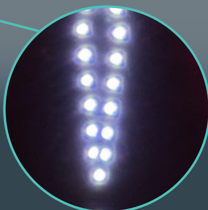
LEDs Nichia japonaises