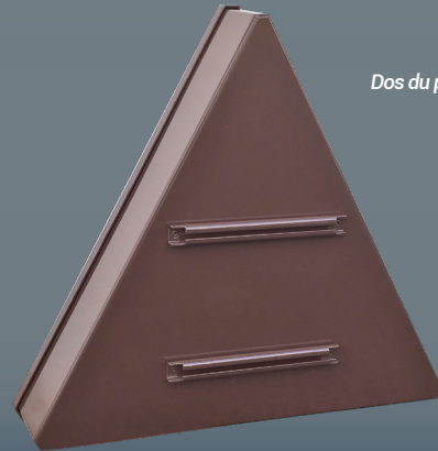
Dos du panneau