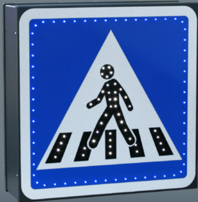
LISTEL ET SYMBOLE RENFORCÉS EN LEDS