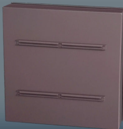
Dos du panneau