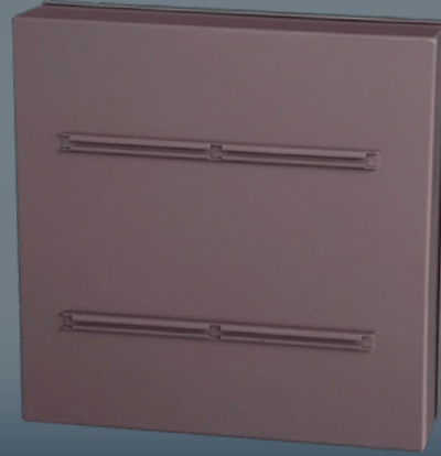
Dos du panneau