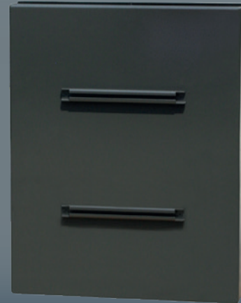
Dos du panneau

Renforcer la sécurité aux passages piétons