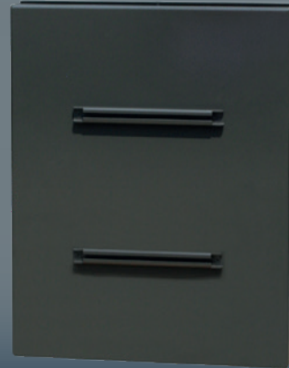
Dos du panneau