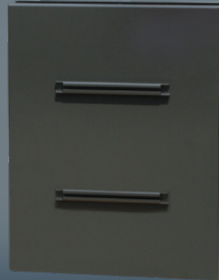
Dos du panneau