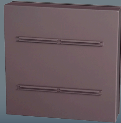
Dos du panneau