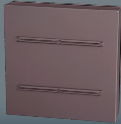
Dos du panneau