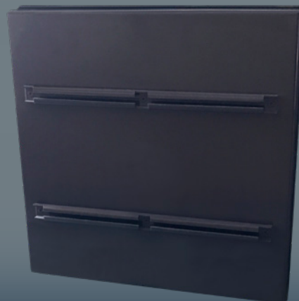
Dos du panneau