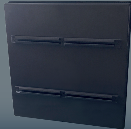
Dos du panneau