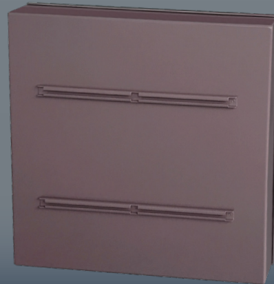
Dos du panneau