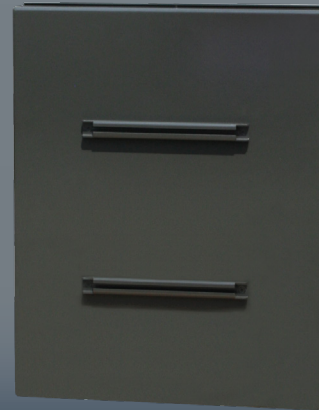
Dos du panneau