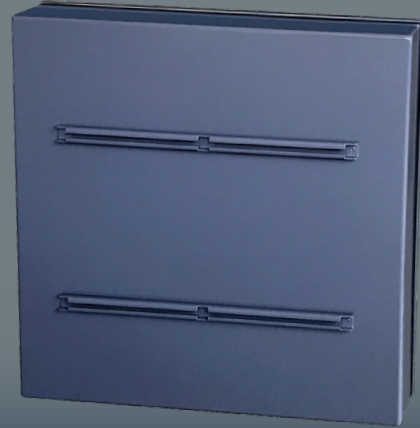
Dos du panneau