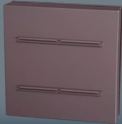
Dos du panneau

MAXIMISATION DE LA ZONE DE RÉTROREFLEXION