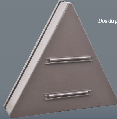
Dos du panneau