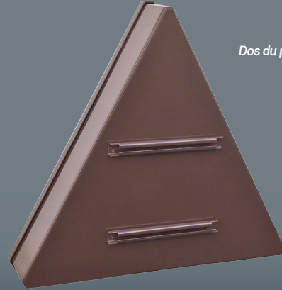
Dos du panneau