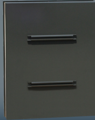
Dos du panneau